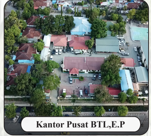
Kantor Pusat BTL,E.P