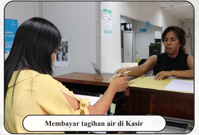
Membayar tagihan air di Kasir