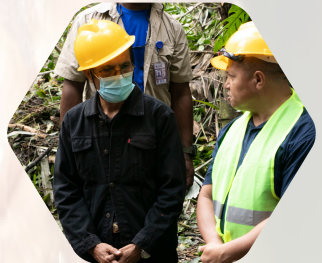
Peluncuran Proyek Konstruksi Sistem Pendistribusian Air Bersih