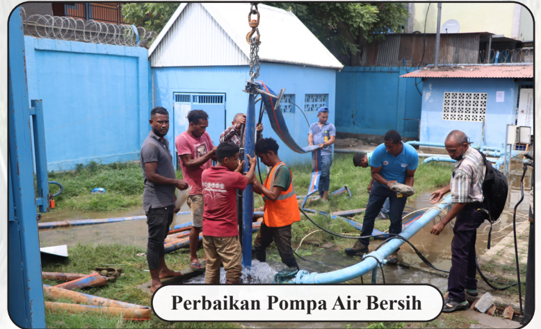
Perbaikan Pompa Air Bersih