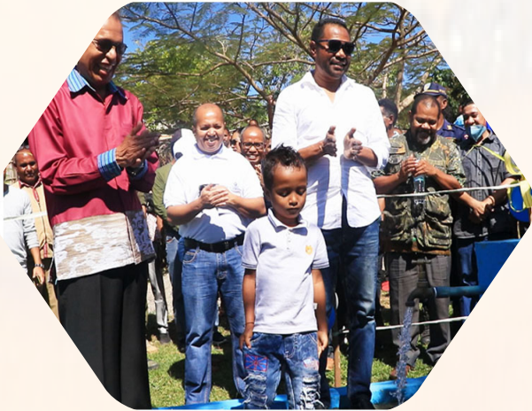
Peresmian Proyek Konstruksi Sistem pendistribusian Air Bersih