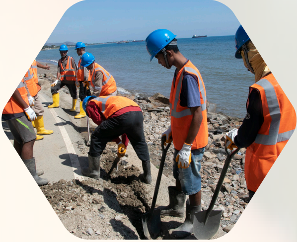
Perbaikan Pipa Distribusi Air Bersih

Kami juga bertanggung jawab untuk meningkatkan sumber daya Manusia dan Sumber daya keuangan di sektor ini.