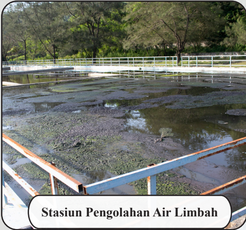
Stasiun Pengolahan Air Limbah