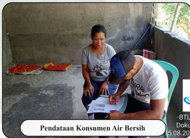
Pendataan Konsumen Air Bersih