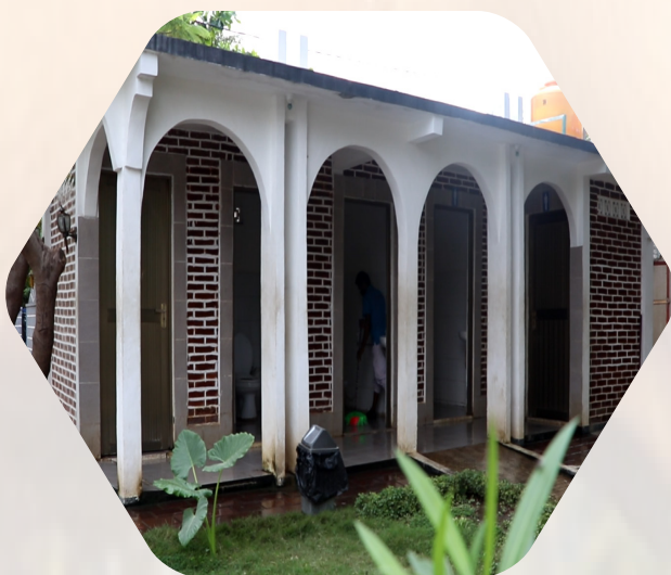
Toilet/WC Umum yang di Kelola oleh BTL,E.P

Drainase merupakan tanggung jawab BTL,E.P untuk menjaga agar tetap bersih