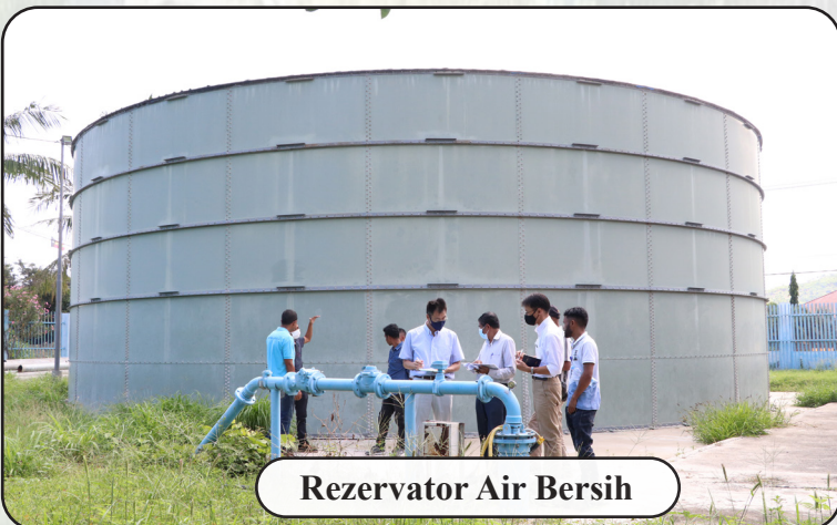
Rezervator Air Bersih