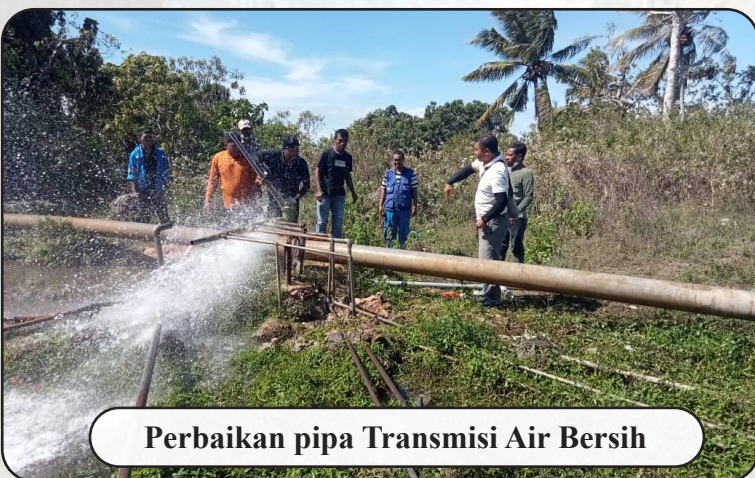
Perbaikan pipa Transmisi Air Bersih