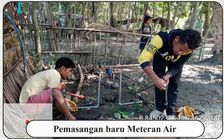
Pemasangan baru Meteran Air