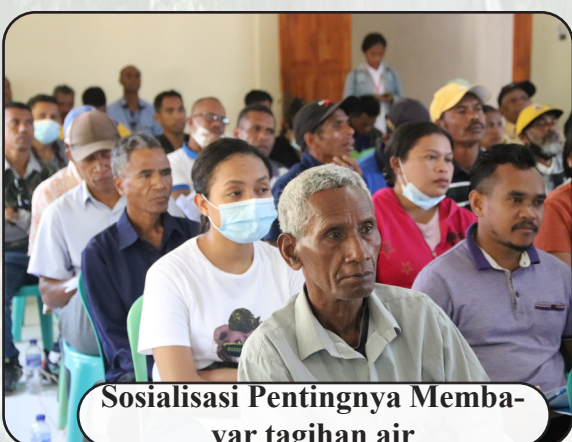
Sosialisasi Pentingnya Membayar tagihan air