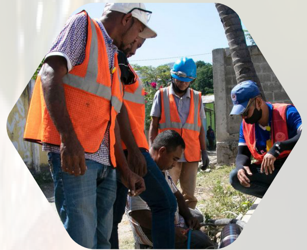
Aktivitas Perbaikan Pompa Air